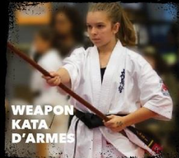
WEAPON KATA D'ARMES